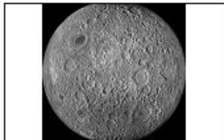
La face visible de la lune

rpi-cheney-dannemoine-tronchoy-89-ac-dijon.fr